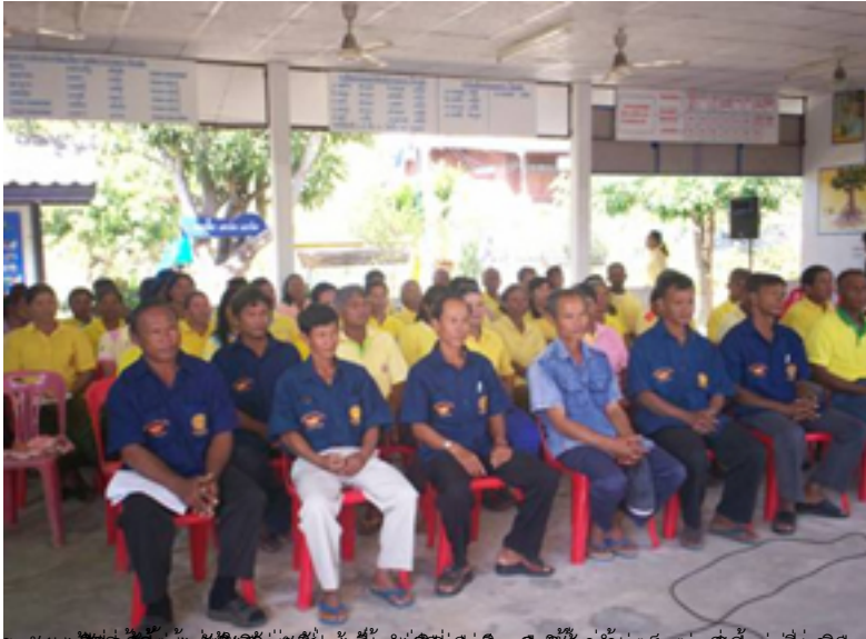
ภาพที่ 1. คณะกรรมการตัดสินรางวัลเกษตรกรดีเด่นแห่งชาติ ประจำปี พ.ศ. 2551 ประเภทกลุ่มเกษตรกรเลี้ยงสัตว์

วันพฤหัสบดีที่ 06 กันยายน 2012 เวลา 19:38 น. - แก้ไขล่าสุด วันพฤหัสบดีที่ 06 กันยายน 2012 เวลา 19:50 น.