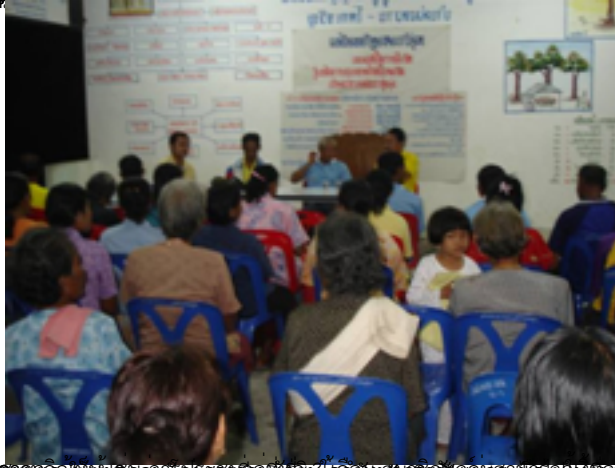
ภาพที่ 2. คณะกรรมการตัดสินรางวัลเกษตรกรดีเด่นแห่งชาติ ประจำปี พ.ศ. 2551 ประเภทกลุ่มเกษตรกรเลี้ยงสัตว์