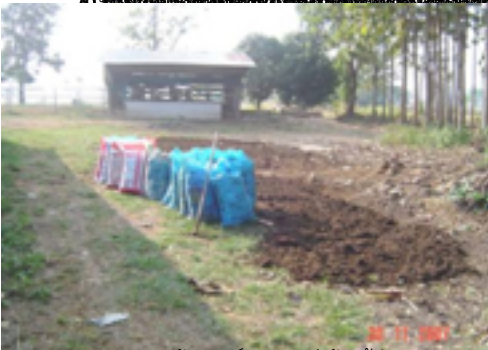
การปลูกพืชไร่และพืชสวนในแปลงปลูกเพื่อเตรียมพื้นที่เพาะปลูกพืชไร่และพืชสวน