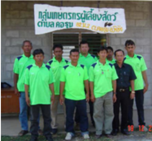
กลุ่มเกษตรกรเลี้ยงสัตว์ตำบลคอชุม

สถาบันเกษตรกรดีเด่นแห่งชาติ (ประเภทกลุ่มเกษตรกรเลี้ยงสัตว์) ประจำปี พ.ศ.2552