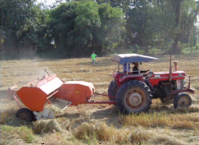
การไถดินด้วยเครื่องจักรกลการเกษตรเพื่อเตรียมพื้นที่เพาะปลูกพืชไร่และพืชสวน

วันพฤหัสบดีที่ 06 กันยายน 2012 เวลา 20:00 น. - แก้ไขล่าสุด วันพฤหัสบดีที่ 06 กันยายน 2012 เวลา 20:14 น.