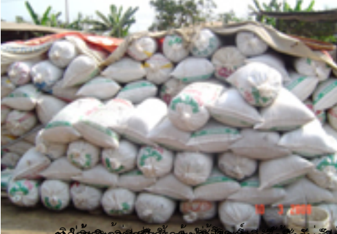
ปุ๋ยเคมีที่ใช้ในไร่และสวน