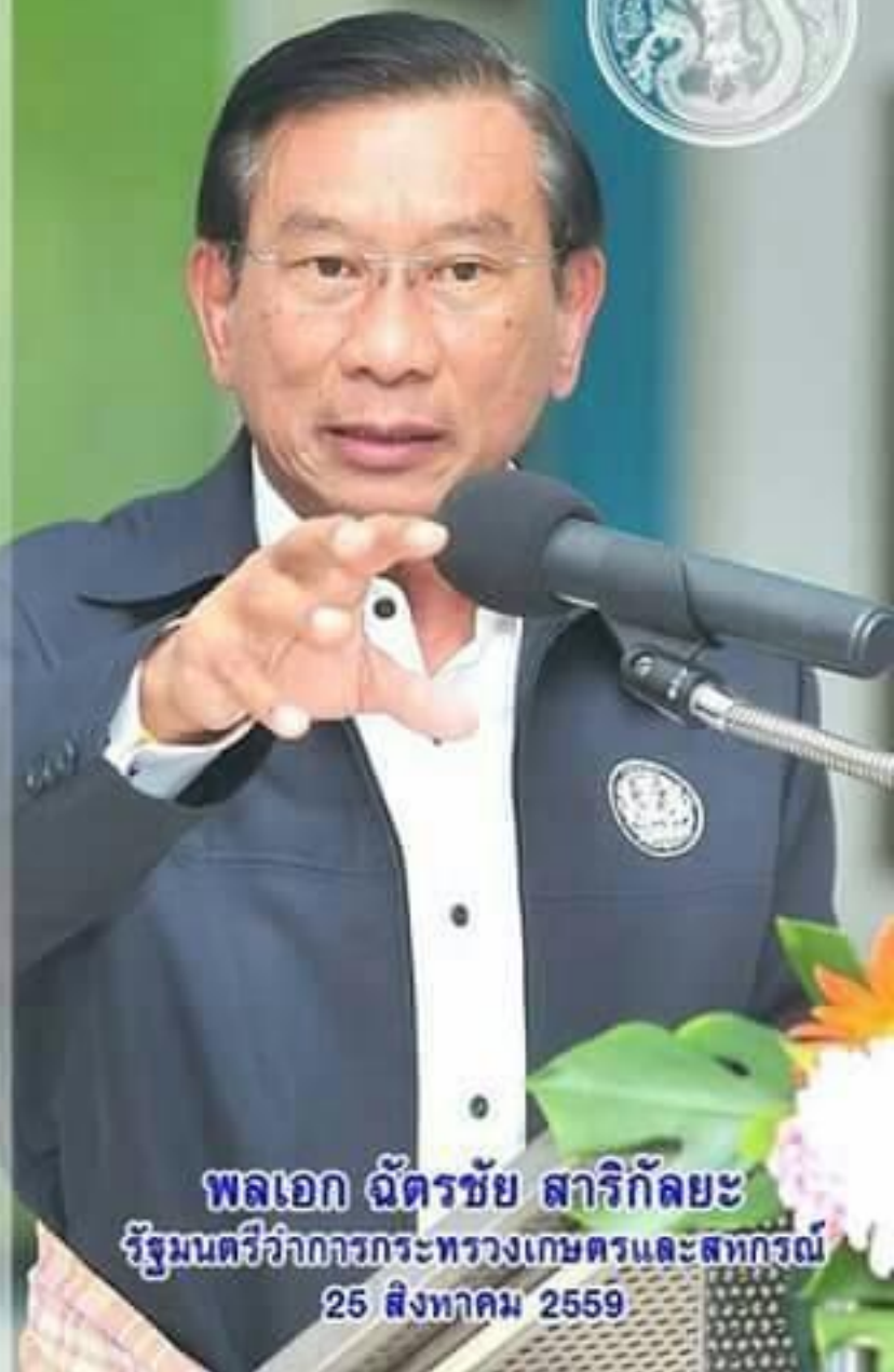
พลเอก ฉัตรชัย สาริกัลยะ รัฐมนตรีว่าการกระทรวงเกษตรและสหกรณ์ 25 สิงหาคม 2559