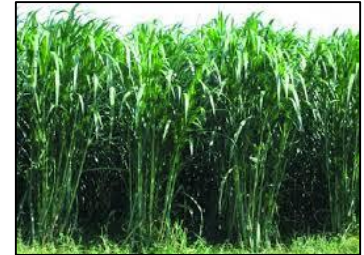
หญ้าเนเปียร์