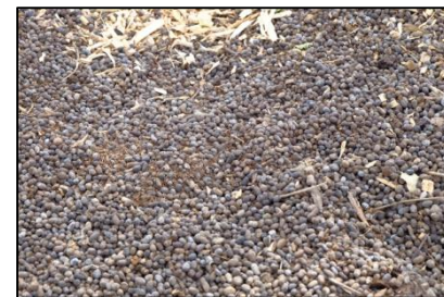
ขี้แพะกากกระถิน (20 บาท/ถุง)