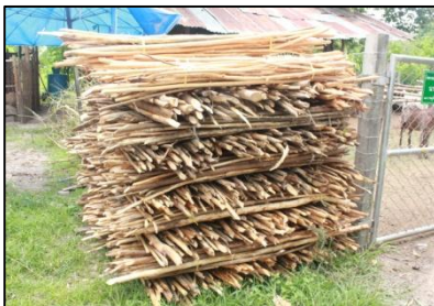
ไม้ตะเกียบ (4 บาท/มัด)